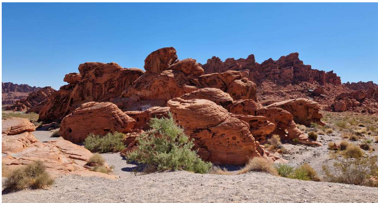
Valley of Fire State Park (Nevada)

USA – Città e Parchi Ovest–(12 Agosto 2024-31 Agosto 2024)