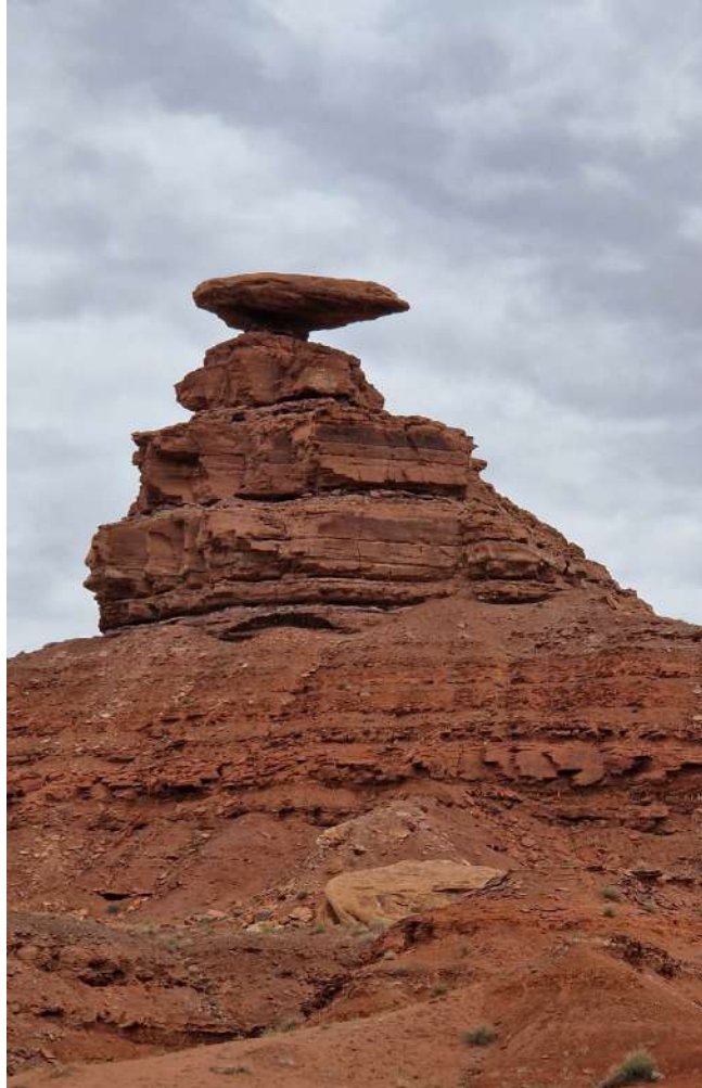
Mexican Hat (Utah)