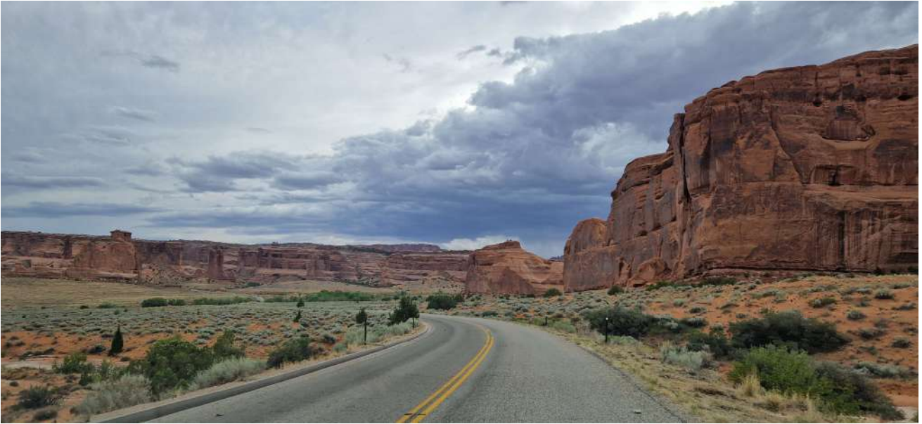
Arches National Park (Utah)

USA – Città e Parchi Ovest–(12 Agosto 2024-31 Agosto 2024)