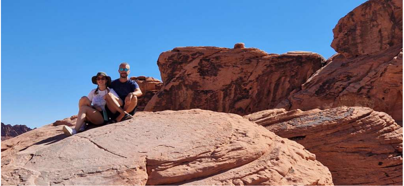
Valley of Fire State Park

USA – Città e Parchi Ovest–(12 Agosto 2024-31 Agosto 2024)