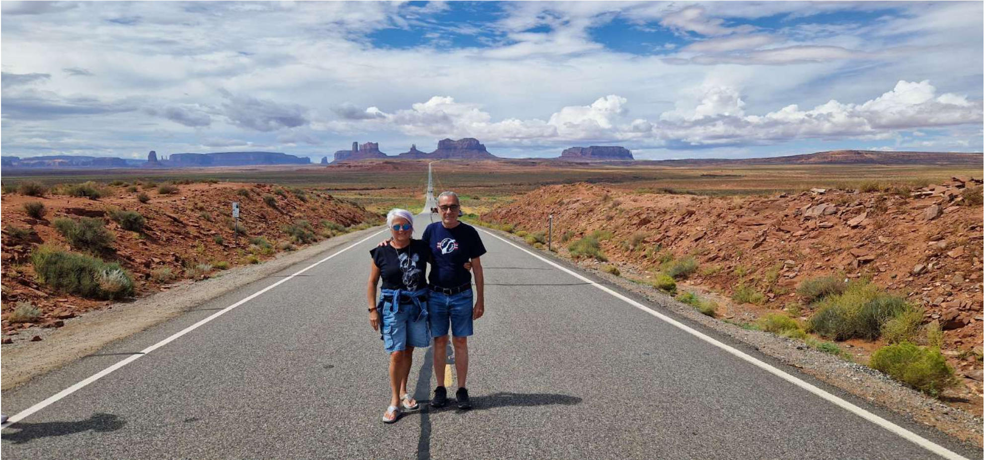
Forrest Gump Point (Confine tra Utah e Arizona)

USA – Città e Parchi Ovest–(12 Agosto 2024-31 Agosto 2024)