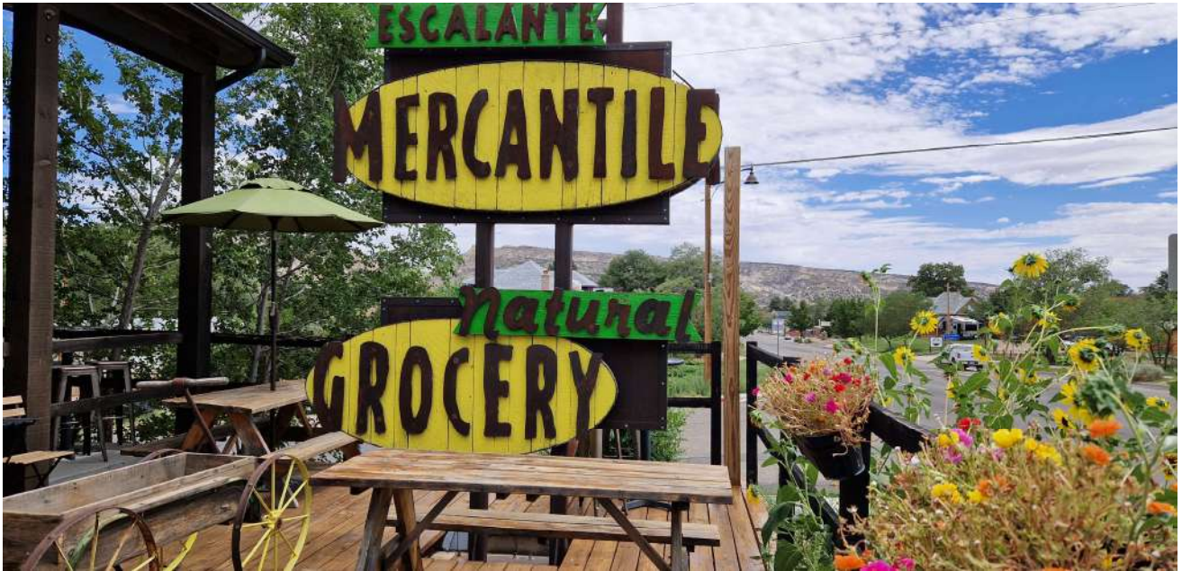
Spuntino in questa grocery in un piccolo paese sperduto nel nulla (Escalante)

USA – Città e Parchi Ovest–(12 Agosto 2024-31 Agosto 2024)