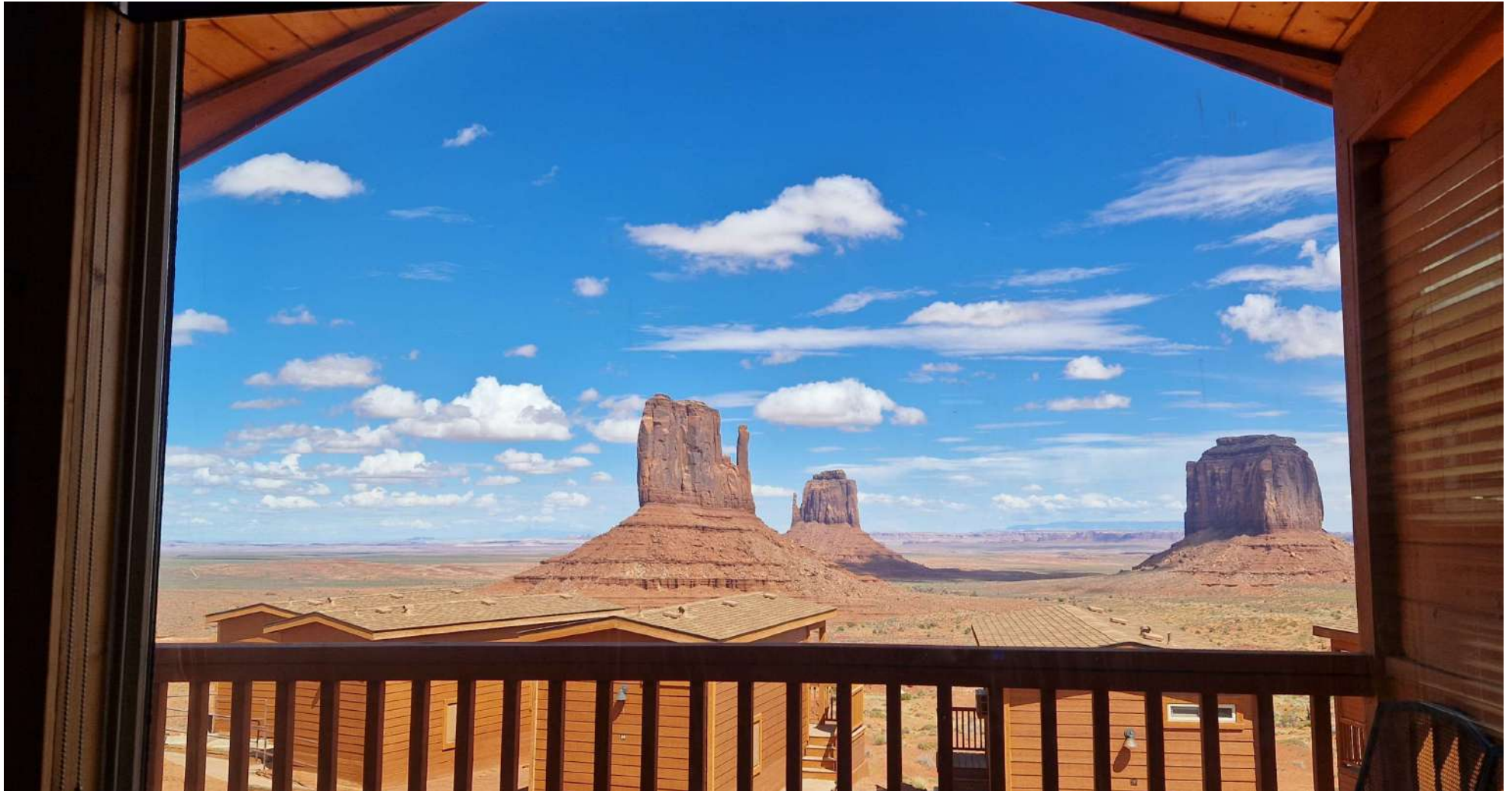
Dalla finestra della nostra cabina alla Monument Valley prima di cena

USA – Città e Parchi Ovest–(12 Agosto 2024-31 Agosto 2024)