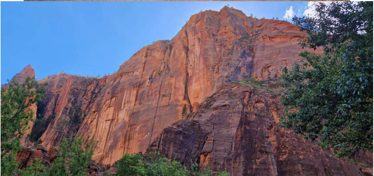
Zion National Park (Utah)