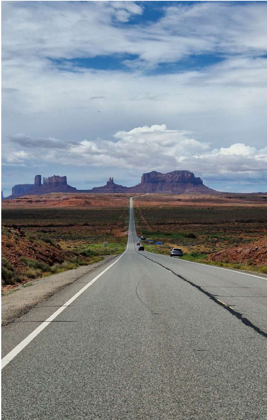
Forrest Gump Point

USA – Città e Parchi Ovest–(12 Agosto 2024-31 Agosto 2024)