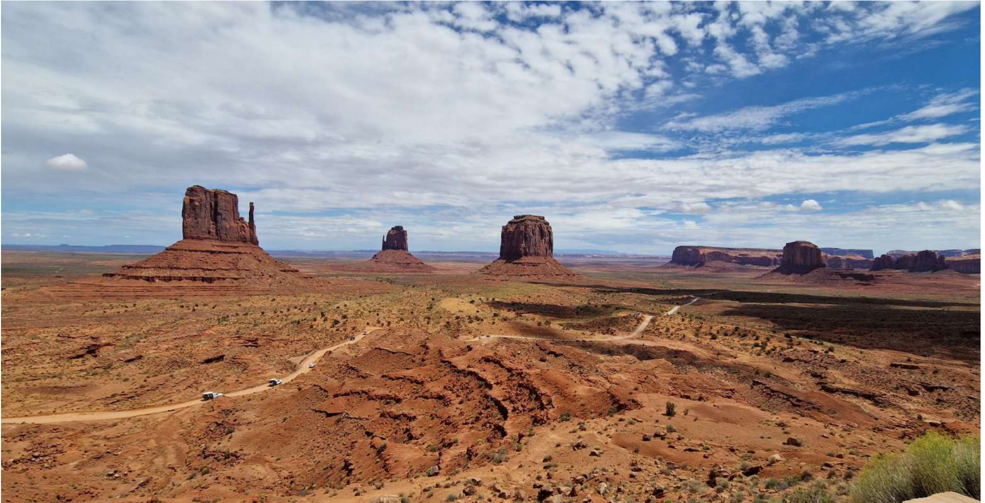
Panorama dall'Hotel The View (in attesa di prendere possesso delle nostre cabine)

USA – Città e Parchi Ovest–(12 Agosto 2024-31 Agosto 2024)