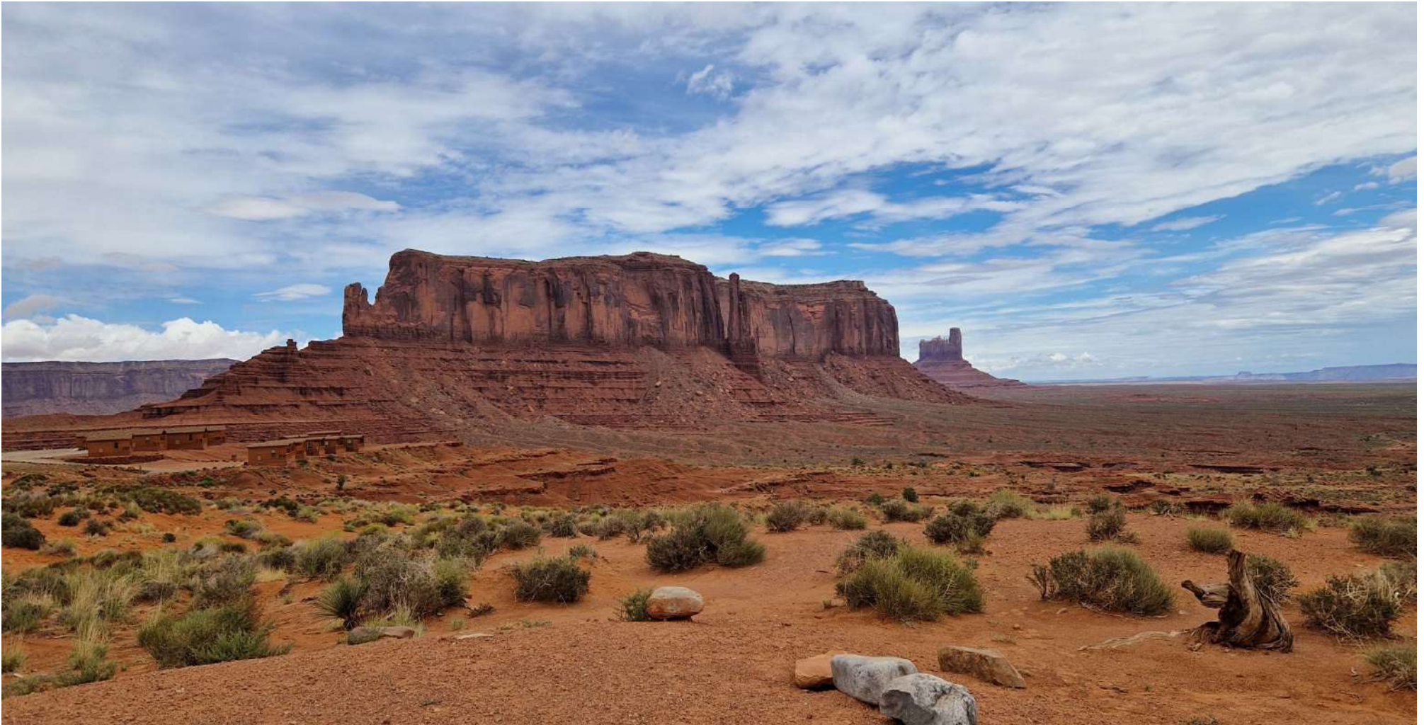
Verso Hotel The View (Monument Valley)

USA – Città e Parchi Ovest–(12 Agosto 2024-31 Agosto 2024)