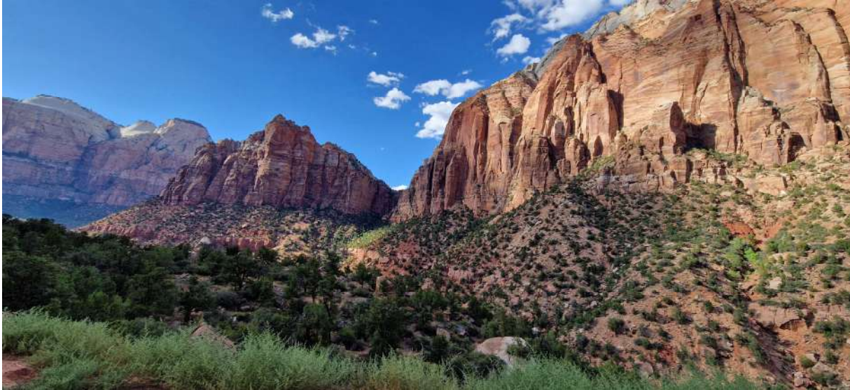
Zion National Park

USA – Città e Parchi Ovest–(12 Agosto 2024-31 Agosto 2024)