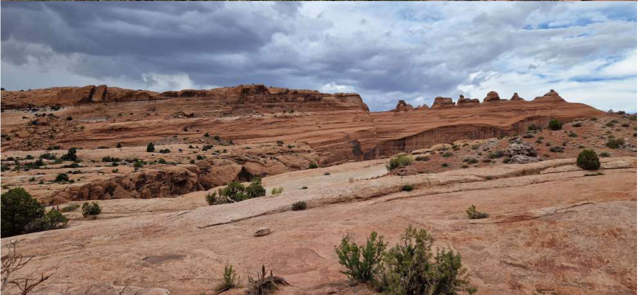
Arches National Park (Utah)