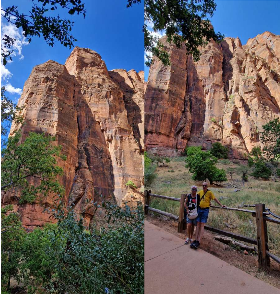
Zion National Park

USA – Città e Parchi Ovest–(12 Agosto 2024-31 Agosto 2024)