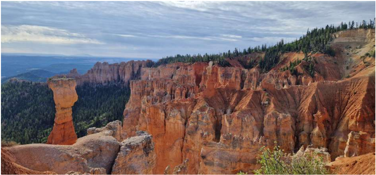
Bryce Canyon (Utah)

USA – Città e Parchi Ovest–(12 Agosto 2024-31 Agosto 2024)