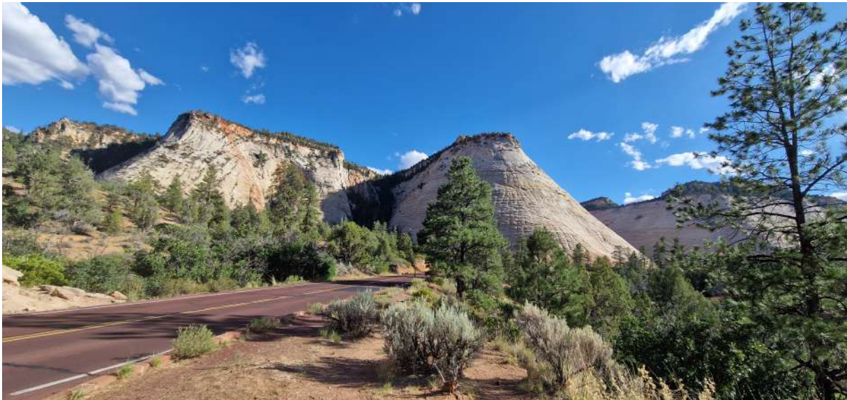
Checkerboard Mesa (2033 mt.)

Situata all'ingresso orientale del Parco Nazionale dello Zion