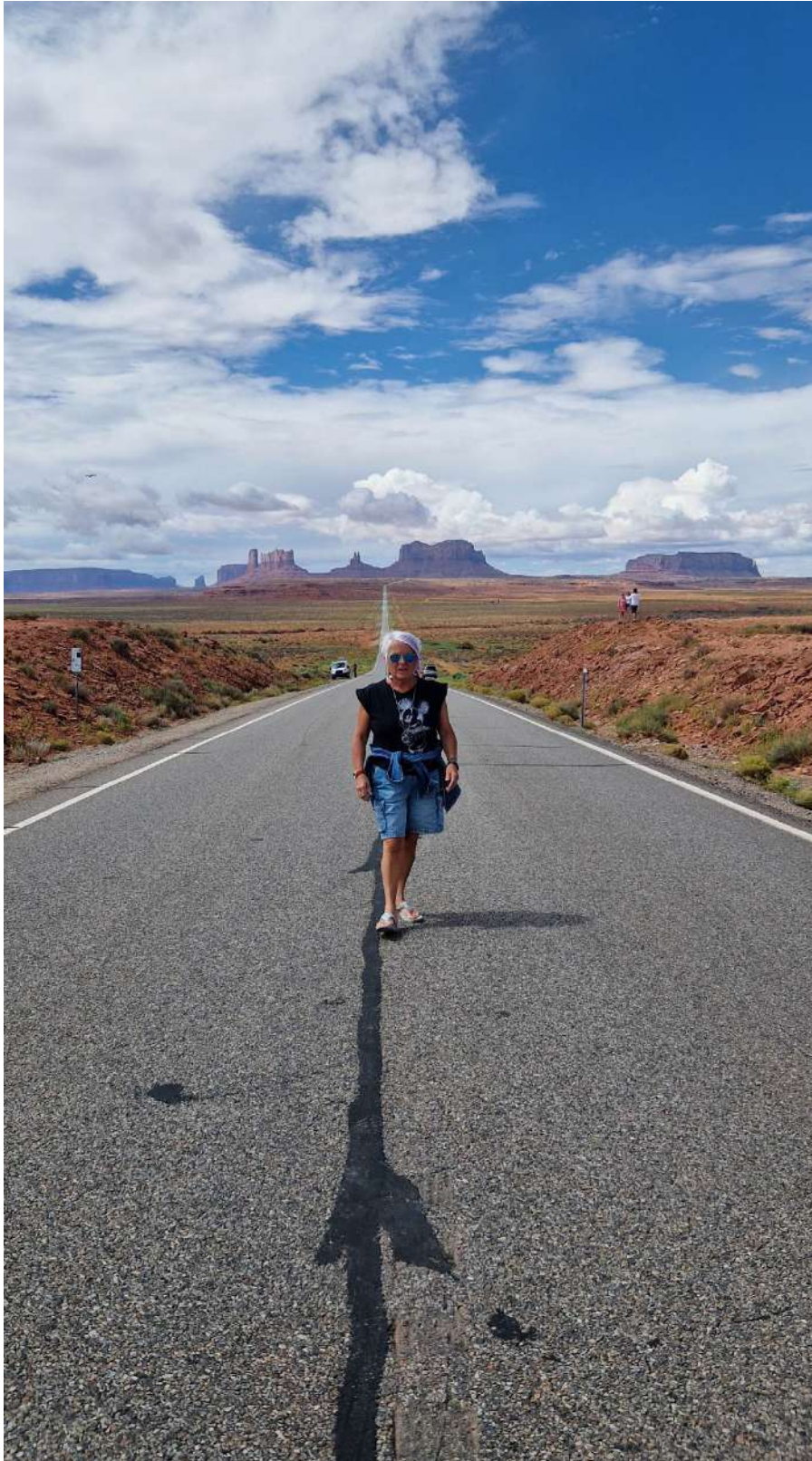
Forrest Gump Point (Utah)

USA – Città e Parchi Ovest – (12 Agosto 2024-31 Agosto 2024)